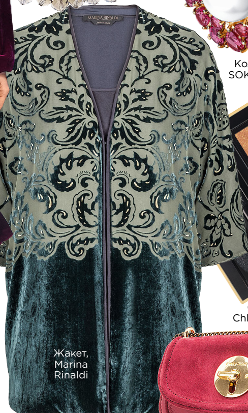
Жакет, Marina Rinaldi