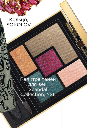
Палитра теней для век, Scandal Collection, YSL