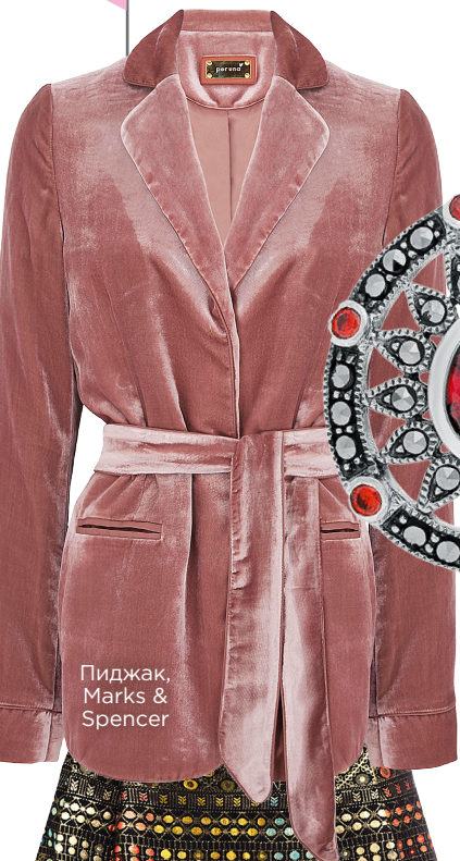
Пиджак, Marks & Spencer