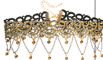
Ожерелье-чокер, Lady Collection